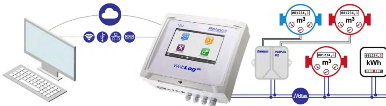
Fernzugriff per Webbrowser